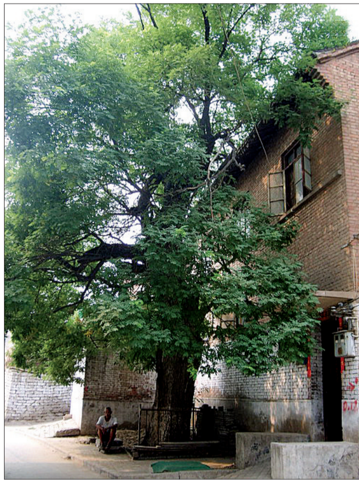
勒马听风街一角（资料图片）

瀍河边有一条叫“勒马听风街”的小巷，宽不过五米，长不过百米，却因一段传奇故事而让人们津津乐道。