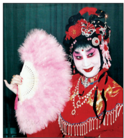
《西厢记》剧照 饰 红娘