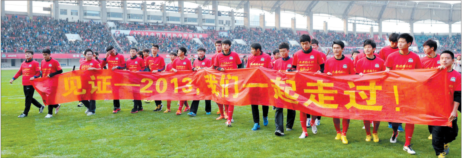
建业将士手拉横幅向球迷致意