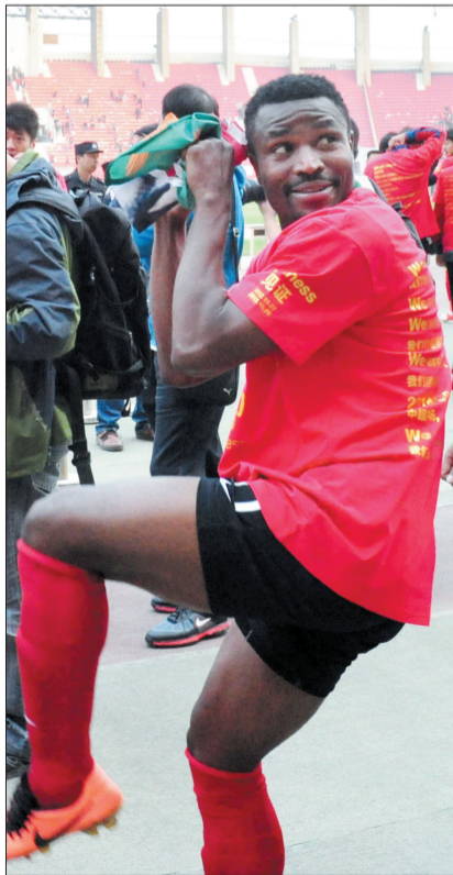
卡通戈准备把礼物抛向看台