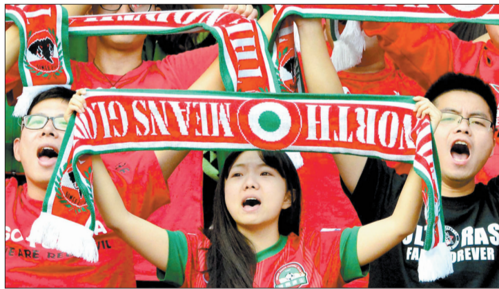
球迷为建业呐喊助威