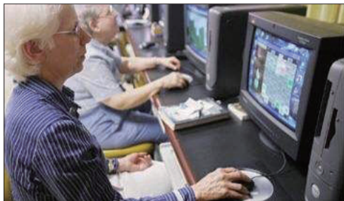
老人在玩电子游戏 (资料图片)