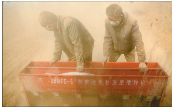
洛宁县小界乡史村村民在地里“寄种”小麦