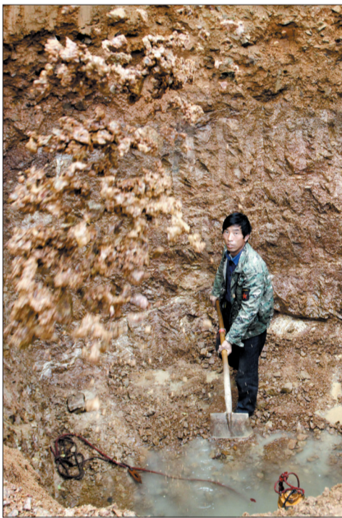
嵩县太山庙村外出务工村民返乡,挖井找水