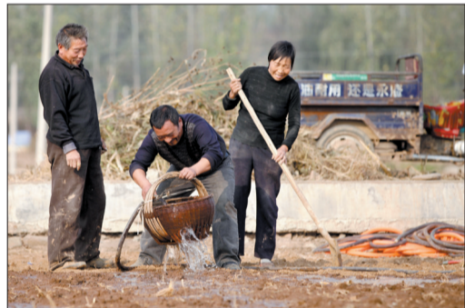
走,嵩县一村民这样浇地 担心以前“寄种”的种子被冲