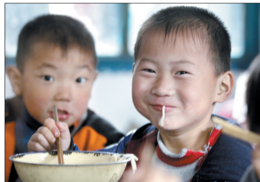
带水到学校,让学生的午饭有保证 汝阳县杨庄小学教师,连续四个月