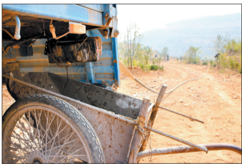
送水车上滴下的水,用手推车接住继续浇地