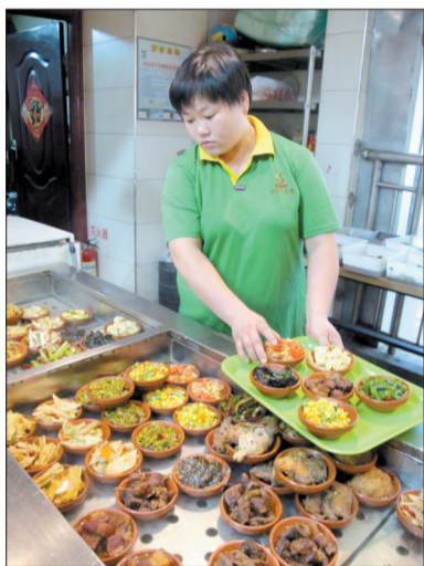
服务员按顾客要求选小碗菜