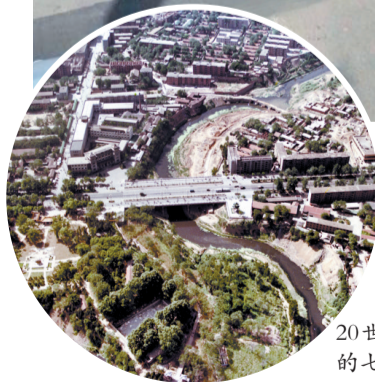
20世纪80年代的七里河桥

散落在河洛大地上的古树名木、古街道、老民宅、旧窑院、古亭台、古城堡等,无不带着河洛文化的鲜明烙印,向我们讲述古往今来的传奇故事。敬请关注,欢迎投稿或提供线索。