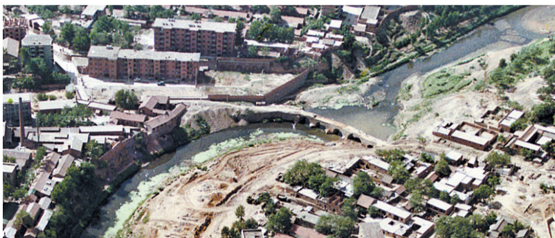
20世纪50年代的七里河桥

现在的七里河中州桥以南300米处,曾有一座七里河老桥,不过这座桥在10年前就已消失了。这座桥曾是洛阳通往西安、潼关等地的要塞,也记载着一拖建厂初期的许多往事。