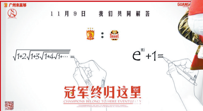
广州恒大官方发布最新亚冠决赛海报

当广州恒大5比0击败武汉卓尔后,如今的时间理所应当进入了亚冠时间。但是,恒大突然亮出一手也实在太绝了。昨天,当恒大亚冠决赛主场海报亮相之后,只引来一阵哀叹声:“哎呀,我的数学弱爆了,恒大这是啥意思呀?”