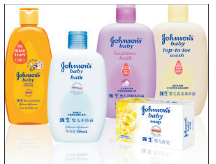
强生公司的部分产品

此前,因违法销售药品,英国葛兰素史克公司和美国辉瑞制药公司分别于2012年和2009年被罚款30亿美元和23亿美元。