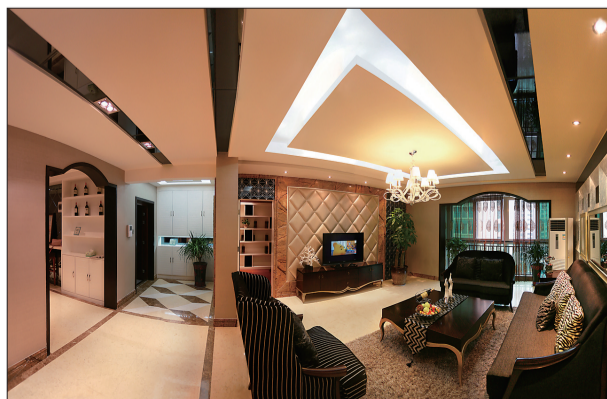
中泰世纪花城样板间实景

据了解，“峰景”已于去年交房，是真正的现房，目前正在清盘中，并推出了三重巨惠活动。