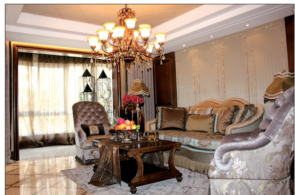
银隆·开元名郡样板间实景 (资料图片)

据了解，该户型的产品位于银隆·开元名郡5期，由于是成熟大社区，社区内的景观已经规划完成，超市等配套设施也很齐全，5期产品将于今年12月交房，明年装修完成就可以入住。