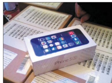
新人把苹果手机当作抽奖礼物， 赠送给亲友 (网络图片)