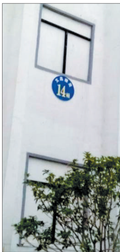
安置房墙面上“画”窗户 (网络图片)

近日，有网友爆料，江西省抚州市一处安置房墙面上“画”有窗户。11月7日，抚州市房管局相关负责人就该市安置房“假窗门”回应：“小区建筑风格为徽派建筑，纯属从设计美学角度考虑，并没有增加建设成本。”