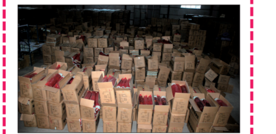
“哈他”瑜伽仓库中待发的货物