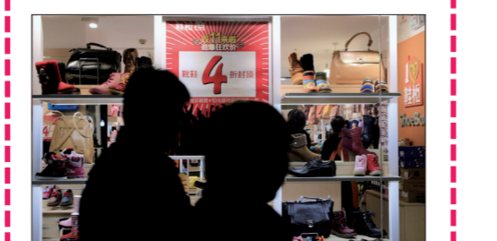
迎接“双十一”实体店也大力促销