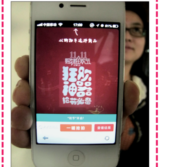
手机成今年抢拍“神器”