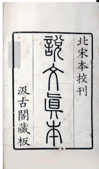
白河书斋所藏《说文》

这是一项开创性的工作,从公元100年到公元121年,许慎历时20余年,才将《说文解字》一书完成。此时他已年老体弱,仍反复推敲、校正书稿,确认无误后,才将该书由儿子许冲献给朝廷。除《说文解字》外,他还著有《五经异义》《淮南鸿烈解诂》等书,可惜已失传。