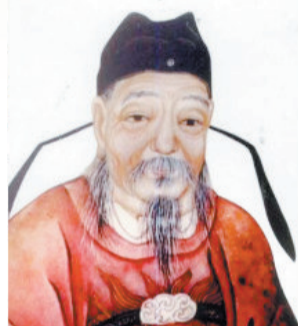
张说画像（资料图片）