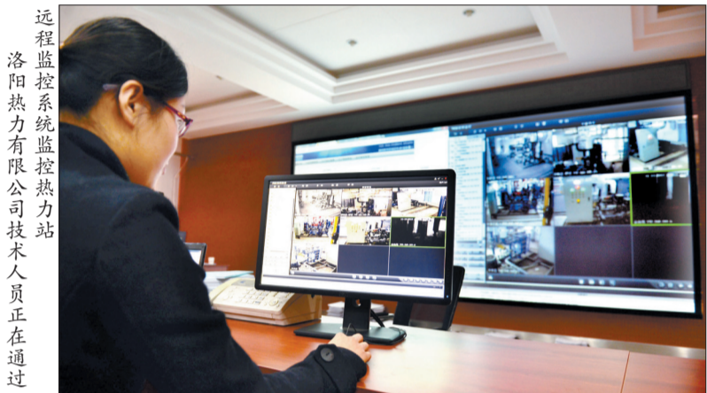
远程监控系统监控热力站 洛阳热力有限公司技术人员正在通过

昨日,洛阳晚报记者从洛阳热力有限公司、洛阳北控水务集团有限公司新区热力分公司以及洛阳高新热力有限公司了解到,目前这三家公司已准备就绪,今日24时,将准时为用户供暖。