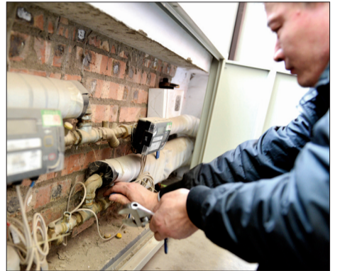
工作人员为供暖用户开启阀门