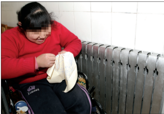
供暖第一天,甜甜就迫不及待地守在了暖气旁

昨天早上一起床,您是不是下意识地摸了摸自家的暖气片热了没?昨天是供暖第一天,洛阳晚报记者走进福利机构、小区居民家中,和您一同感受“咱家的温度”。