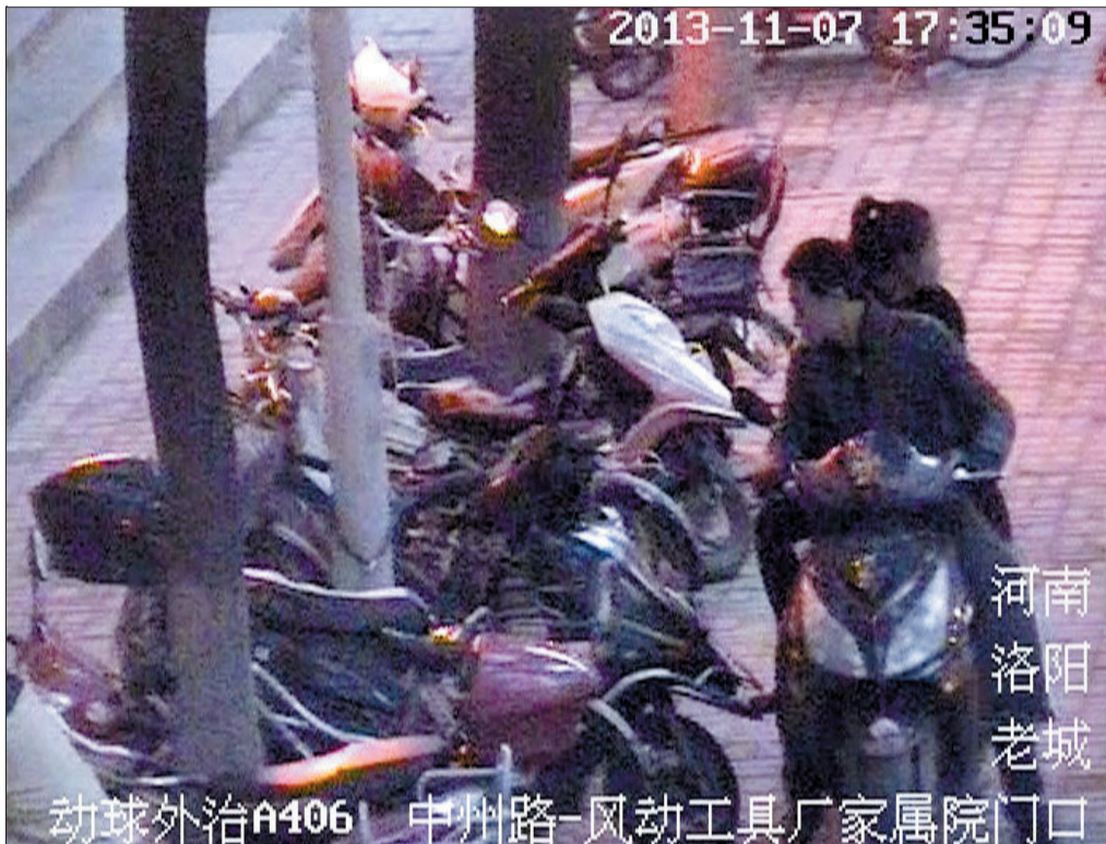
两名嫌疑人正在街头观察,看哪一辆电动车最适宜下手 (视频截图)