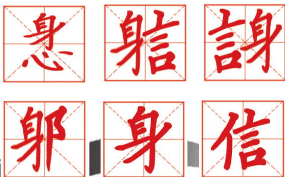
战国时期“信”字的6种写法