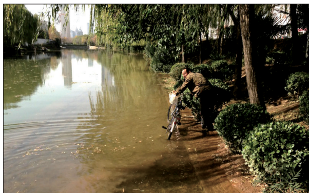
渠边的小路已经被水淹没了