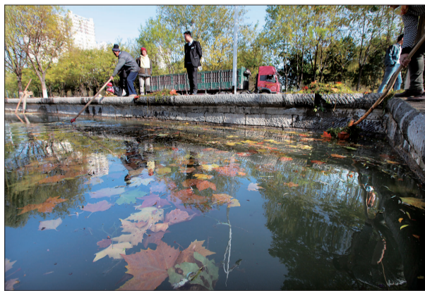
热心市民正在打捞落叶

经过近1个小时的打捞,人工渠里的水开始缓缓流动。13时许,路面上的水基本都流回了渠中。