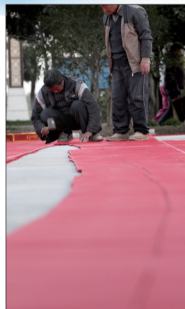
工人在铺设新型地板