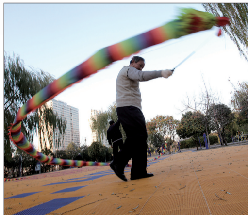
已有市民在空竹园一展身手