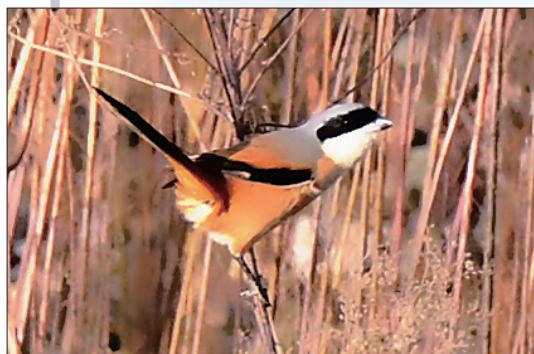
棕背伯劳飞累了,停在芦苇上