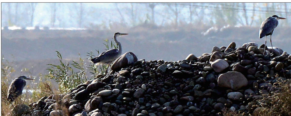
岸上的苍鹭看起来颇为自在