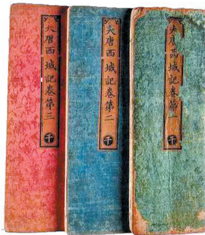
白河书斋所藏《大唐西域记》