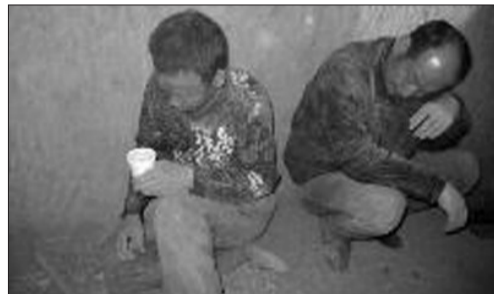
被救出的嫌犯满身是土