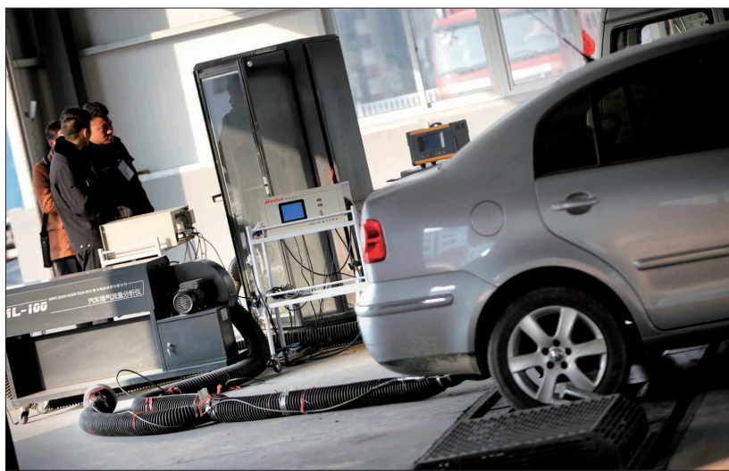
工作人员正在检测汽车尾气质量

限行期限临近,您的车接受环保检测了吗?昨日,洛阳晚报记者来到检测站之一——洛阳市永顺汽车检测有限公司,对机动车尾气的检测流程、领取环保标志应携带哪些证件等问题进行了采访。