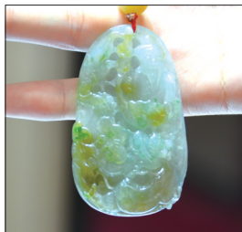
翡翠挂件——福寿如意 材质:糯种翡翠