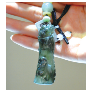
翡翠挂件——指日高升 材质:糯种翡翠