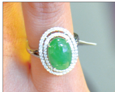
翡翠戒指 材质:糯种翡翠配钻石 圆满如意 健康长寿