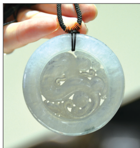
翡翠挂件——龙牌 材质:冰糯种翡翠 吉祥、富贵、安康