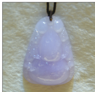
翡翠挂件——葫芦 材质:紫罗兰翡翠 葫芦谐音“福禄”, 寓意带来福禄,和谐美满