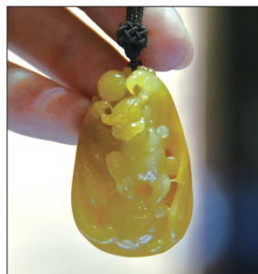
翡翠挂件——蝙蝠 材质:黄翡 蝙蝠谐音“遍福”, 象征幸福绵延无边