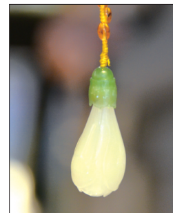
白玉兰挂件 材质:和田白玉 高尚纯洁、典雅华贵、 安乐幸福运气