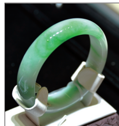
翡翠手镯 材质:糯种翡翠