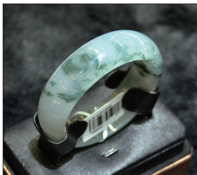
翡翠手镯 材质:冰糯种飘蓝花翡翠