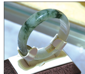
翡翠手镯 材质:冰糯种飘蓝花翡翠