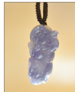
翡翠挂件——貔貅 材质:紫罗兰翡翠 招财进宝