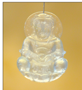
翡翠挂件——观音 材质:高冰种翡翠 吉祥如意 和睦美满