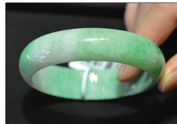
翡翠手镯 材质:糯种翡翠 吉祥、平安、逢凶化吉