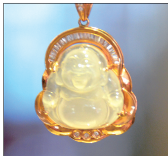
翡翠佛挂件 材质:冰种翡翠配钻石 佛谐音“福”,有佛(福)相伴, 保佑平安健康