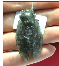
翡翠挂件——蝉 材质:油青种翡翠 一鸣惊人