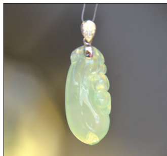
翡翠福瓜挂件 材质:冰糯种翡翠配钻石 福瓜多子,外形简洁饱满, 寓意多子多福,财源滚滚