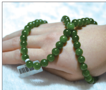
碧玉项链 材质:和田碧玉 玉质细腻,颜色均匀 娇艳,晶莹剔透