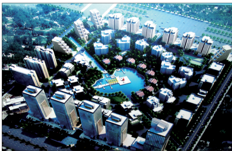
炎黄科技园规划效果图