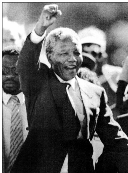
曼德拉获释出狱后向欢迎他的人群挥手致意(1990年2月11日摄)