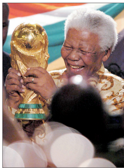
曼德拉手捧大力神杯，庆祝南非获得2010年世界杯比赛主办权(2004年5月15日摄)