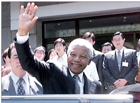
▲ 1992年10月，曼德拉首次访华并登上长城