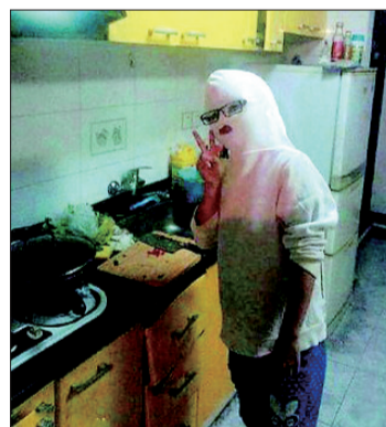
@生活报:从此以后,做饭再也不怕被油溅到了。