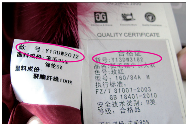
衣服上的款号和货号不一致

工商人员表示,由于未见到其负责人,该上衣商标牌是否被更换等细节尚无法核实,如果相关情节属实,该商家便涉嫌侵犯他人的注册商标专用权。