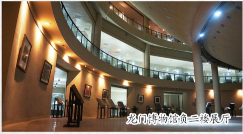
龙门博物馆负三楼展厅

龙门博物馆位于龙门石窟景区北入口处，主要收藏、展示、研究佛教文化器物及河洛文明遗存。馆体为“天圆地方”的佛塔底座式建筑，体现中国传统文化理念和佛教“圆”、“空”的思想内涵，展厅分地上、地下共四层，主要展示佛教及河洛文明之精品。