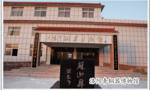
洛阳青铜器博物馆

为河南省重点文化产业企业，其制作工艺传承已历经400余年，研发商周时期高仿青铜器近七大类四百余个品种，其独到的手工工艺、无以伦比的精湛造型、厚重的文化内涵、奇异的创新思想，堪称中国一绝。