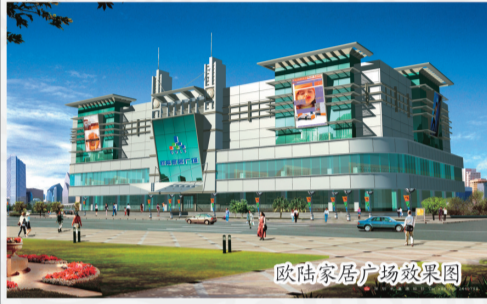
欧陆家居广场效果图

公司下属的欧陆新世纪家居博览中心以“传承中国家居文化，创造现代幸福生活”为己任，以“专业、品质、诚信、服务”为商场品牌定位，被河南省家具协会授予“洛阳红木第一楼”称号。