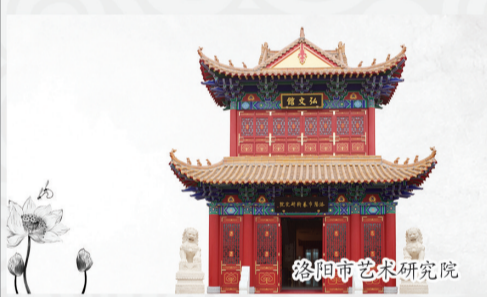
洛阳市艺术研究院

洛阳市艺术研究院下设书法艺术研究所、国画艺术研究所、篆刻艺术研究所、佛教艺术研究所、民间艺术研究所、工艺美术与非物质文化遗产研究所等16个研究所和《文化河洛》杂志编辑部，汇集洛阳各门类艺术人才百余位。