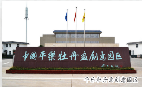
平乐牡丹画创意园区

洛阳平乐国色牡丹画有限公司采取“公司+园区+画师”的模式进行经营管理。被河南省文化厅授予“河南省文化企业50强”；二期“雅颂天香”项目入选“河南省重点文化产业项目”。目前，正在申报国家3A级文化旅游景区。