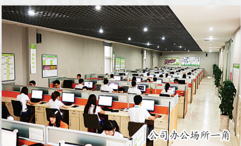
公司办公场所一角

该公司通过八年的努力，目前已发展成国内瑜伽行业的龙头企业。该公司始终围绕瑜伽产业做延伸发展，通过举办各种行业大赛、媒体、门户、培训、展会、交流等活动，将在洛阳打造一个世界级的瑜伽文化中心。