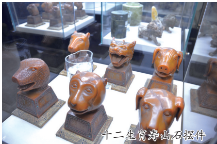
十二生肖寿山石摆件