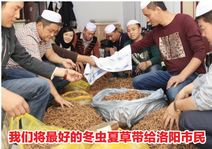
我们将最好的冬虫夏草带给洛阳市民