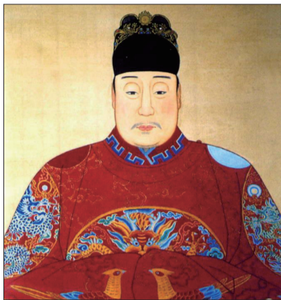
吕维祺像 (资料图片)

我国古代典籍浩如烟海,其中不少与洛阳相关:或由洛阳人所著,或所述为洛阳事,或成书于洛阳……在那些发黄的纸张背后,闪耀的都是智慧的光芒。在本系列中,我们选取部分古籍,看看它们当年的模样。