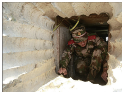
边防队员在清理用于挖掘地道的设备