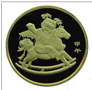
近日发行的马年纪念币

网友“紫石竹话”总结得好:“岁末年初,大家都在展望未来。因为马年将至,所以‘马上××’才能引起网友的共鸣,配上形象的漫画,表达对未来的期许。”