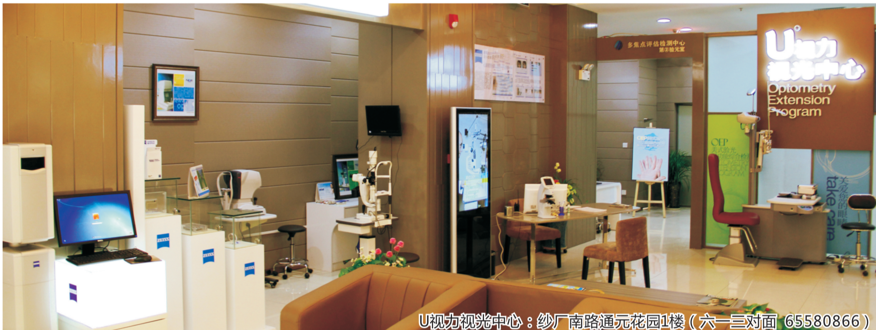
U视力视光中心：纱厂南路通元花园1楼（六一三对面 65580866）