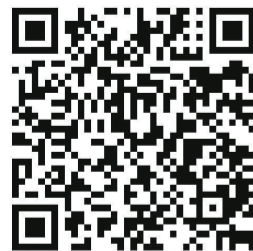
《洛阳晚报·休闲周刊》二维码