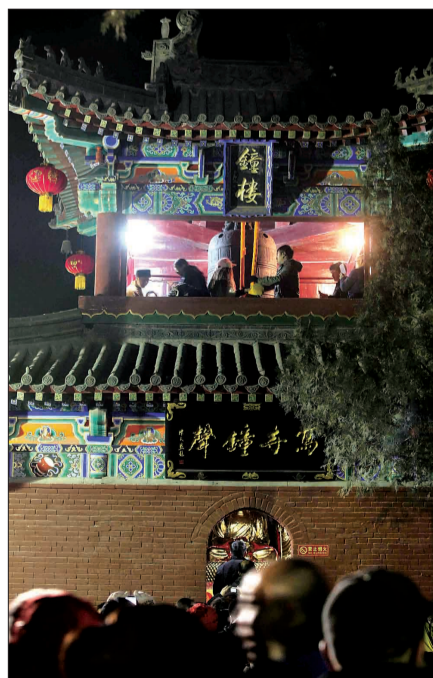
排队登楼,撞钟祈福