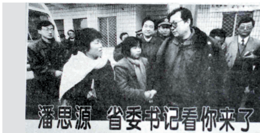
李长春看望潘思源和家人 (版面截图)