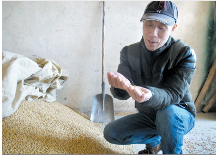
樊合信查看大豆的品质