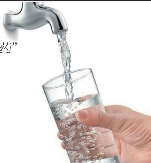
(本版图片均为网络图片)