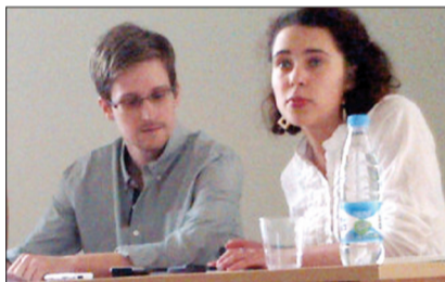
这是斯诺登(左)7月21日在俄罗斯莫斯科谢列梅捷沃机场同国际人权组织代表会面的资料照片

●12月5日,南非前总统纳尔逊·曼德拉因病医治无效去世,享年95岁。曼德拉是中南关系的奠基人之一,对发展中南友好、中非关系做出了重要贡献。