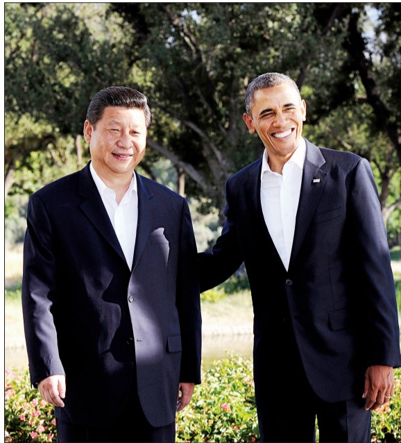
习近平与奥巴马会晤