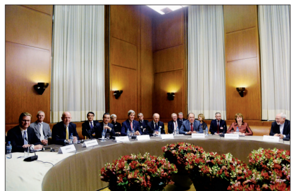
伊朗核问题六国(美国、英国、法国、俄罗斯、中国和德国)与伊朗11月24日凌晨在日内瓦达成伊核问题第一阶段协议

11月24日,伊朗与伊核问题六国在日内瓦就解决伊核问题第一阶段措施达成协议,内容包括伊朗同意暂停生产丰度为5%以上的浓缩铀等。协议的达成标志着通过外交手段解决伊核问题迈出重要的第一步。 2014年上半年,伊朗能否按照协议落实相关具体措施,西方国家是否相应减轻对伊朗的制裁,直接关系伊朗核问题的走向。