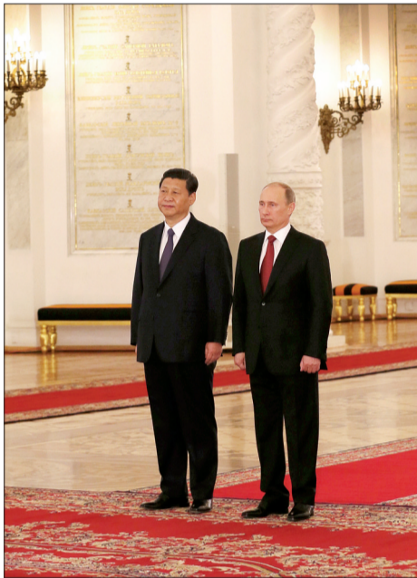
习近平出席俄罗斯总统普京举行的欢迎仪式

2013年,我们影响世界,世界影响我们;我们感谢世界,世界感谢我们。 2013年,我们欣喜地看到,中国与世界的接触进一步加强,在国际事务中,中国的大国地位逐渐凸显,正在发挥着越来越显著的作用。 科技的发展使地球变成一个村庄,使这个村庄变得更美更新,世界期待中国的参与,这一切都要求我们的国力更强,对国际形势的判断更准,更加坚定不移地走独立自主、和平共处、共同发展的外交之路。 2014年,我们期待中国更美、世界更美!