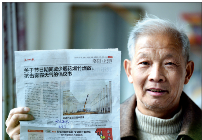
市民在晚报上签字,响应倡议