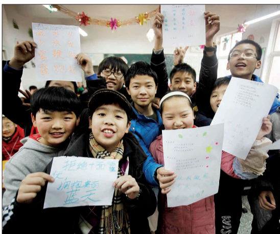
学生们展示“不放鞭炮”宣言