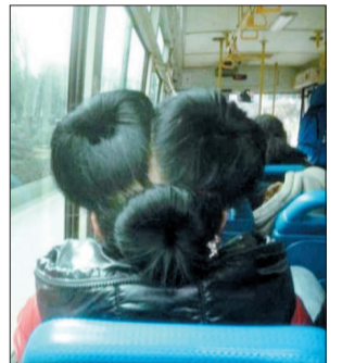
@冷笑话精选:我看了5秒钟才看明白这是啥……