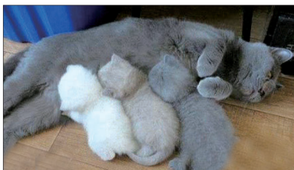
▲ 打印机油墨用完了