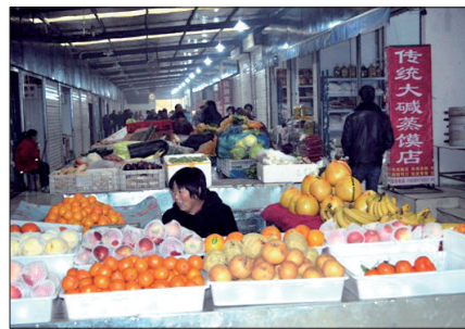
农改超市场内秩序井然,灯火通明

工作。据了解,该农改超市场总占地面积1100余平方米,总投入144万多元,有门面房40间、摊位14个,可容纳经营商户54户。该农改超市场的投入使用,不但可满足社区居民平时的生活需求,还能解决周边小区超市少、居民购物难的问题,对规范市场、保持环境卫生也将起到促进作用。