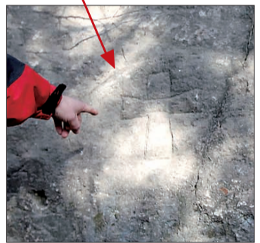
基督教的十字架、胡人姓氏之「石」——神秘墓穴背后藏着多少谜团?