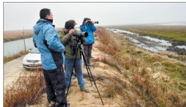
「河南野鸟会队」队员在比赛中