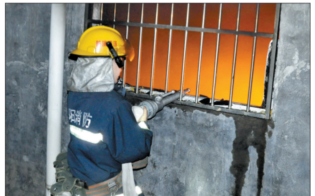
消防队员正在灭火