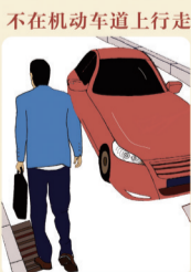
不在机动车道上行走